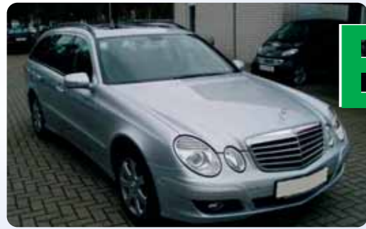
Mercedes Benz E 220 T CDI Classic 2008 modell, se eget produktark for priseksempel